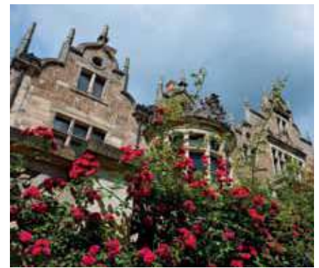
18 SCHLOSS UND PARK ALTENSTEIN