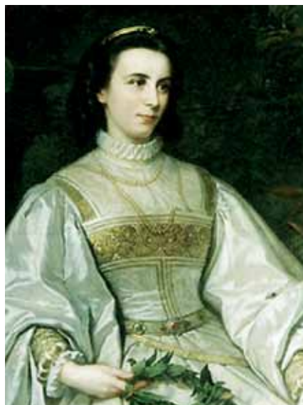
Foto unten: Ellen Franz, dritte Ehefrau von Georg II., 1870 Foto oben: Herzog Georg II. von Sachsen-Meiningen, (* 2. April 1826 in Meiningen; † 25. Juni 1914 in Bad Wildungen)

mit der Reform des Regietheaters in die Kulturgeschichte ein.