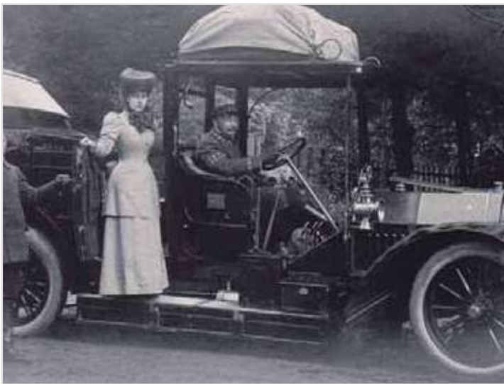
Herzogin Charlotte von Sachsen-Meiningen

Fotos und Inforamtionen Seite 27: Archiv : Heimatfreunde