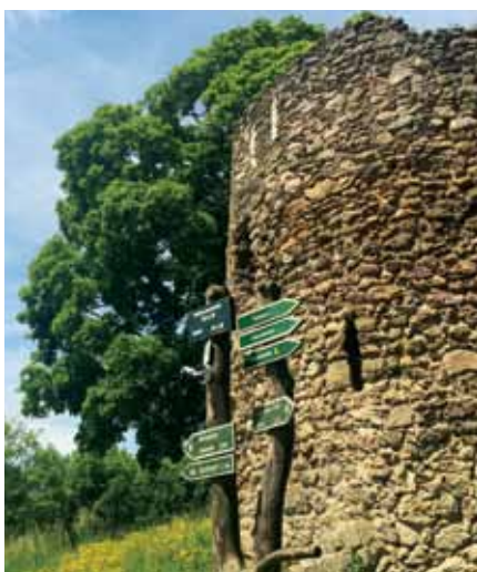
6 DIE BURGRUINE

VERANSTALTUNGEN UNTER: WWW.BAD-LIEBENSTEIN.DE/VERANSTALTUNGEN