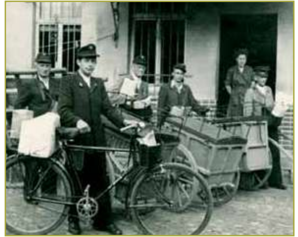
Postfahrrad hinter der (alten) Liebensteiner Post. Archiv Horst Schneider

Fotos und Inforamtionen Seite 27: Archiv : Heimatfreunde