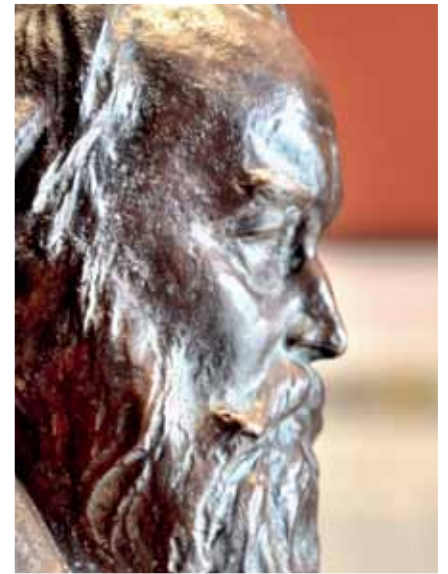
8 DIE BRAHMS GEDENKSTÄTTE AUF SCHLOSS ALTENSTEIN

VERANSTALTUNGEN UNTER: WWW.BAD-LIEBENSTEIN.DE/VERANSTALTUNGEN