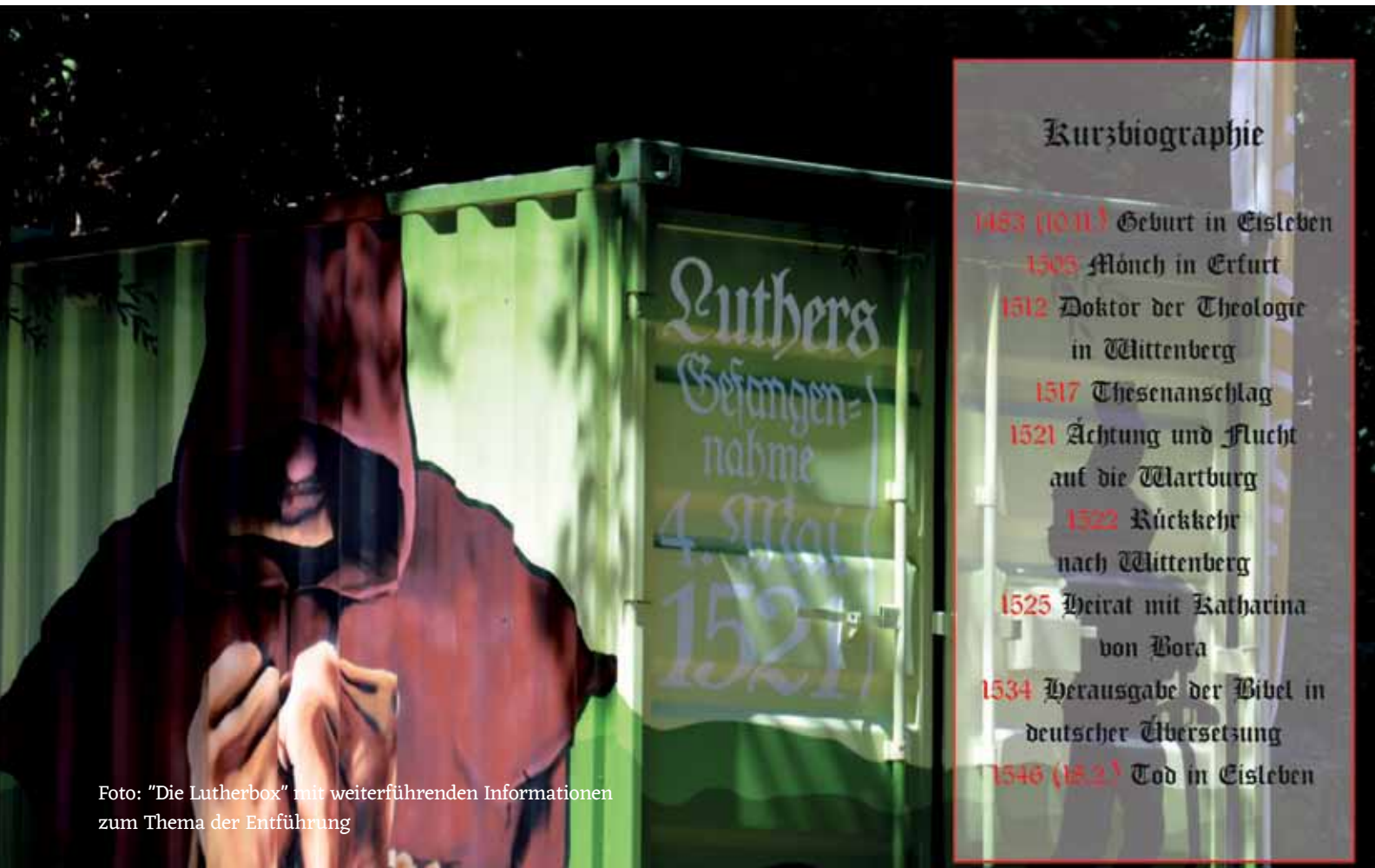
Foto: "Die Lutherbox" mit weiterführenden Informationen zum Thema der Entführung