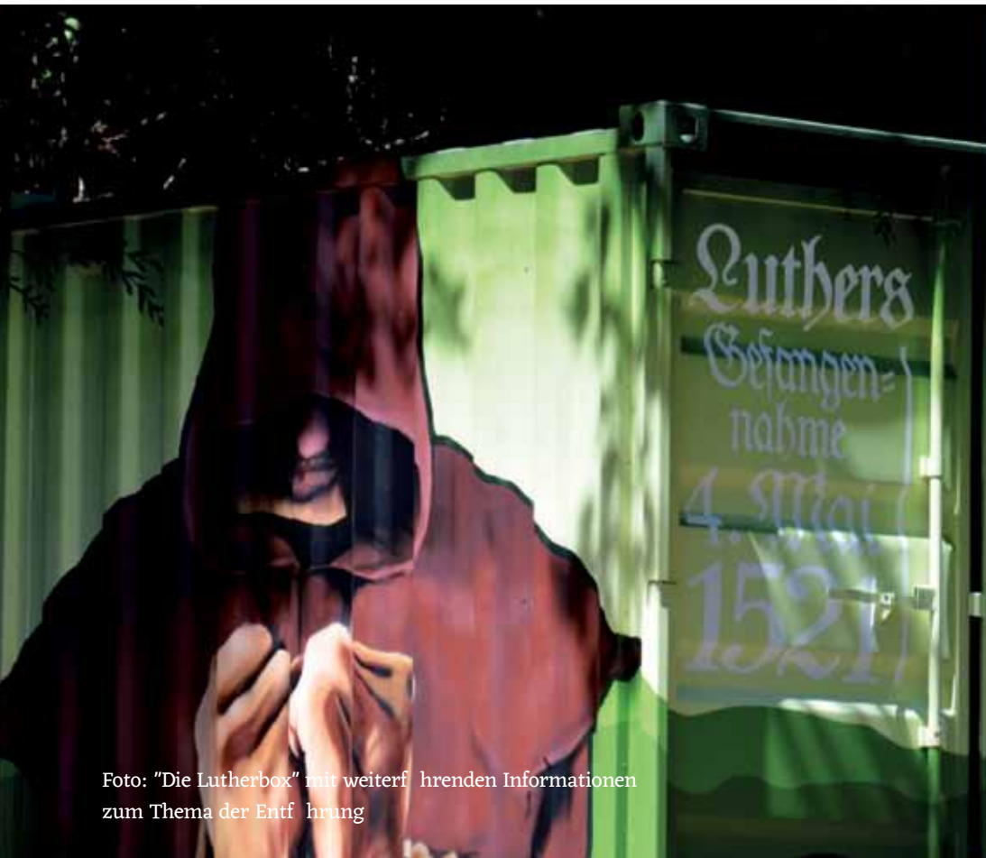
Foto: "Die Lutherbox" mit weiterföhrenden Informationen zum Thema der Entföhrung