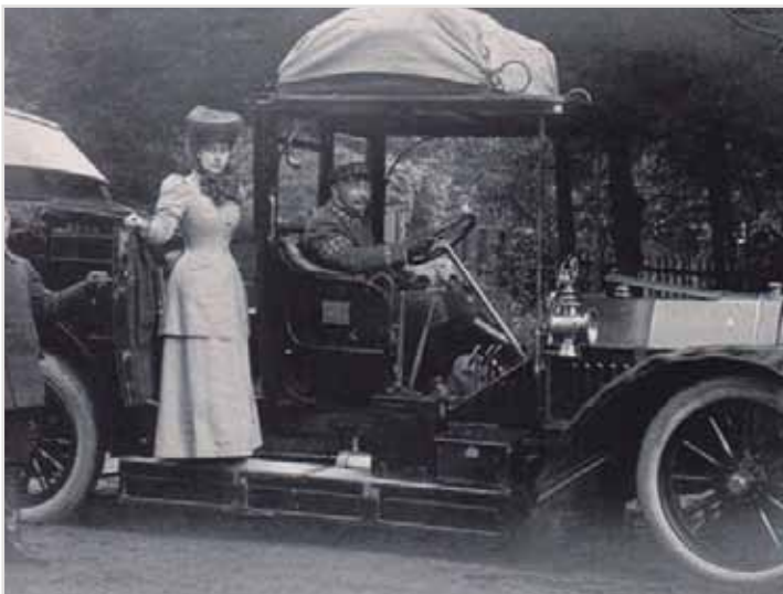
Herzogin Charlotte von Sachsen-Meiningen

Fotos und Inforamtionen Seite 27: Archiv : Heimatfreunde