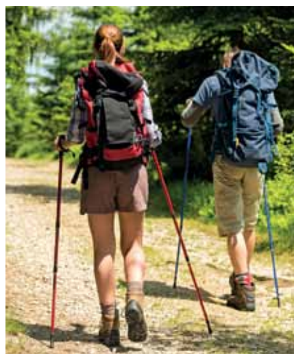
24 DER RENNSTEIG