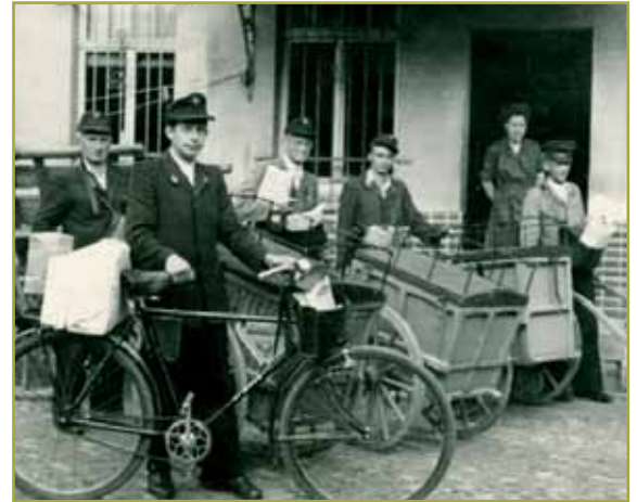
Postfahrrad hinter der (alten) Liebensteiner Post. Archiv Horst Schneider

Fotos und Inforamtionen Seite 27: Archiv : Heimatfreunde