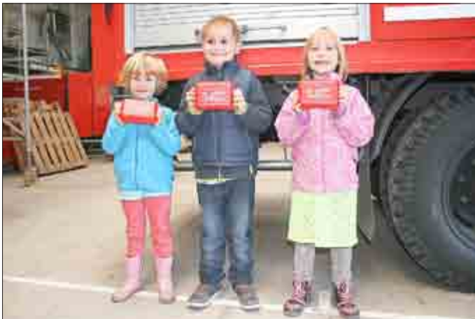
Schüler der Grundschule Bad Liebenstein freuen sich über ihre Brotbüchsen