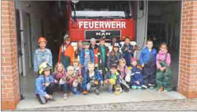
1. Klasse der Grundschule Schweina nach der Anprobe der Einsatzbekleidung

Stadt Bad Liebenstein“. Das Interesse einiger Schüler wurde durch den Besuch in der Feuerwehr bereits geweckt.